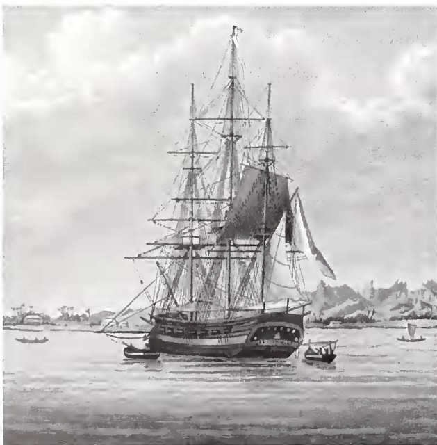
Fig. 1. The corvette La Coquille .